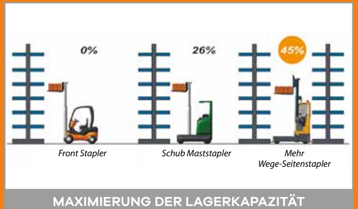
MAXIMIERUNG DER LAGERKAPAZITÄT