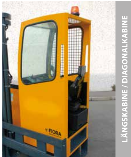
LÄNGSKABINE / DIAGONALKABINE